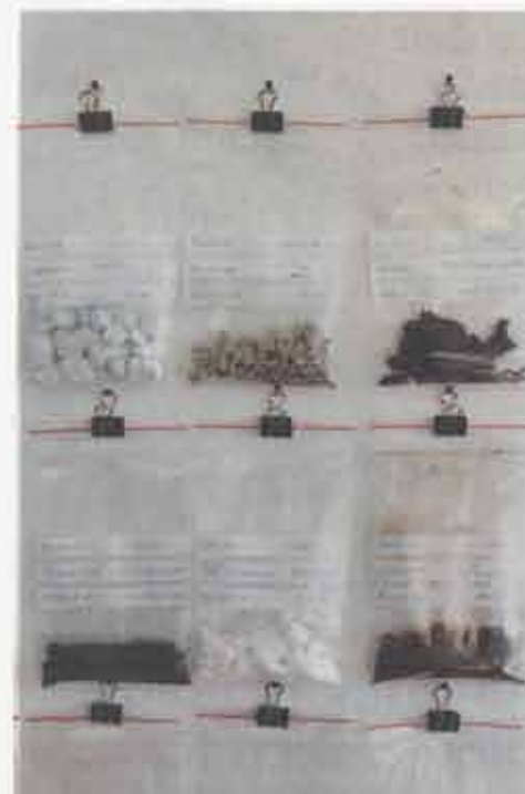
Historieberättare. Jordsamlingen började för femton år sedan, mest av en tillfällighet. I dag omfattar den över 300 berättelser, platser och öden.

O kej, vi tar väl det där med jordsamlare allra först.